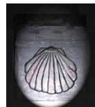
Chapelle "Notre Dame de Pitié"

Situé en Haute Vallée d'Aure, le village de Cadeilhan-Trachère est un balcon orienté plein Est qui surplombe les villages de Saint-Lary-Soulan et Vignec et donne aux touristes une vue imprenable sur toute la vallée (Altitude 930). Village pastoral accroché au Pic de Lumière dont la superficie dépasse les 600 hectares, il est limitrophe des communes d'Aragnouet et Tramezaygues à l'Ouest, St Lary Soulan au Sud et à l'Est, Vignec au Nord et Nord-Est. Entre 1791 et 1801, les villages Cadeilhan et Trachère étaient distincts. Ils seront rassemblés pour être inscrits au canton de Vielle-Aure. La commune est traversée par la Départementale n° 123a appelée aussi Ténarèze. Cet itinéraire était un accès pour les pèlerins de St Jacques qui souhaitaient passer la frontière par la vallée du Rioumajou ou par Aragnouet. Une coquille St Jacques sculptée sur un des piliers de l'église prouve le passage des pèlerins de retour de Compostelle. Avant 1930, l'accès au village s'effectuait par Vignec pour desservir le fond de vallée et Tramezaygues. En 1654, les habitants firent le vœu d'édifier une chapelle s'ils réchappaient à l'épidémie de peste qui ravagea la région. Elle fut construite à l'entrée Nord du village et baptisée "Notre Dame de Pitié". Chaque année une messe y est célébrée le 15 août. En 2005, la population est de 56 habitants permanents.